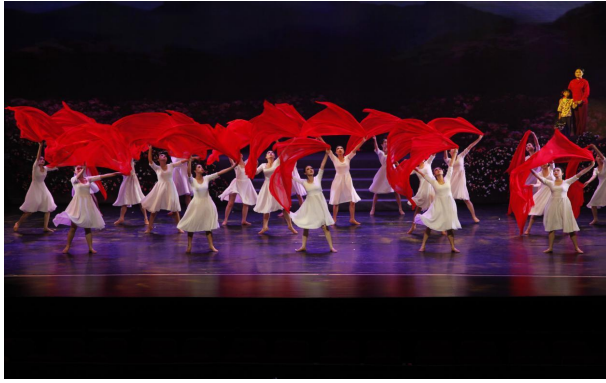
图3 学生参与《党的女儿》舞蹈演出剧照