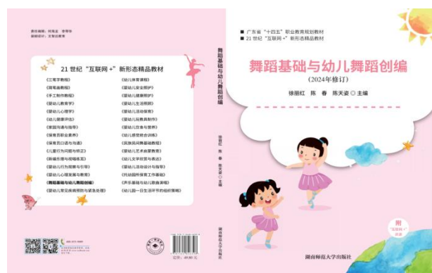
图 2 “十四五” 职业教育国家规划教材