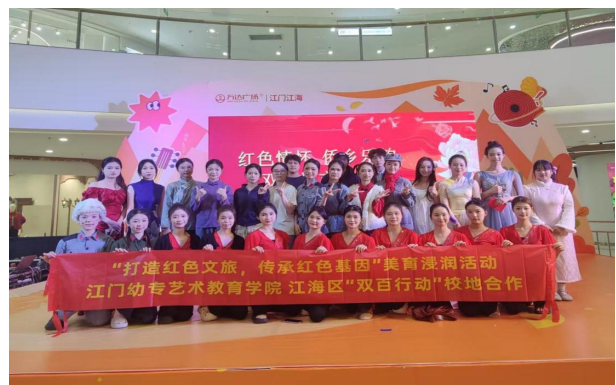
图6 “红色情怀侨乡乐韵”红色美育文艺汇演