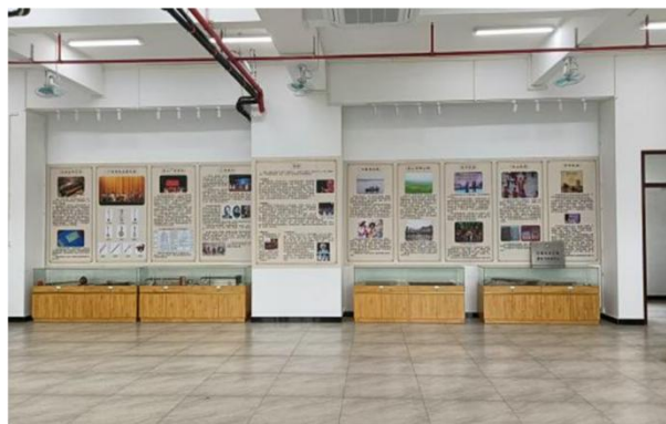
图 2 区域音乐文化传承中心