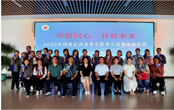
图1 印尼华文教育交流暨幼儿师资专业培训活动

资共享机制：每年互派教师短期交流，共同开发本土化华文幼儿教材，利用线上平台开展跨国教研与文化主题直播。联合市侨务局、侨联打造“同心·聚力”侨务品牌，形成“培训—签约—辐射—反馈”可持续合作闭环。