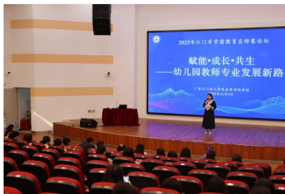
图4 2025年江门市学前教育名师慧论坛