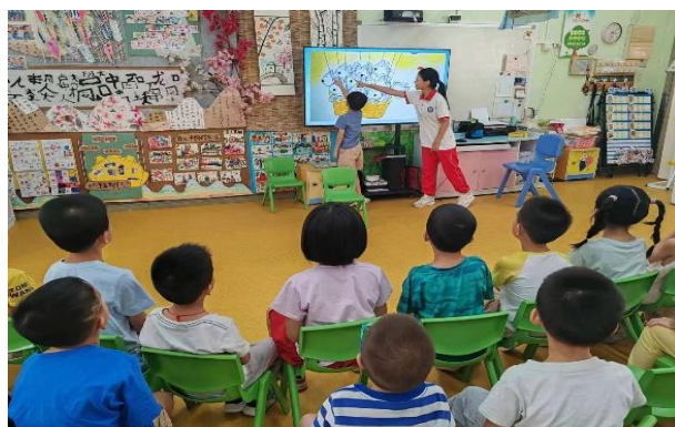
图 2 学生在合作园开展教学实践