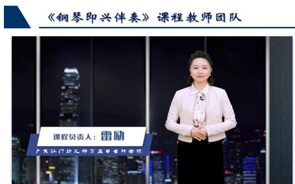
图1《钢琴即兴伴奏》省级在线课程

以智慧职教为载体，分级推进省、校两级精品在线开放课程与课程思政示范课程建设。五年间建成12门精品在线开放课程，培育6门在线课程，建成14门校级继续教育在线课程，在建10门继续教育课程，建成17门专业群核心建设课程。2023-2024年立项10门校级课程思政示范课程，2门课程入选省级课程思政示范项目并顺利结项。截至2025年底，建成校级精品在线开放课程64门、省级精品在线开放课程2门，形成覆盖核心专业课、教师教育课与继续教育课的多层次课程体系，实现知识传授、技能培养与价值引领统一。