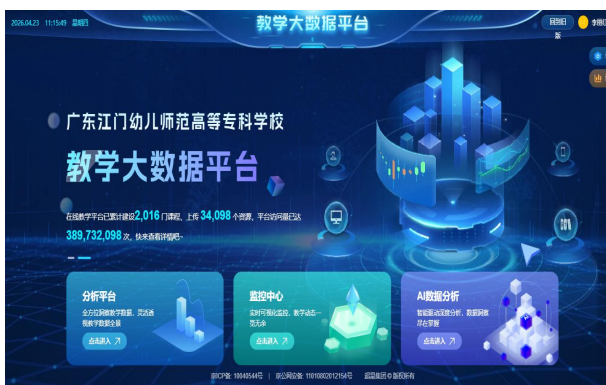
图5 教学大数据平台在线课程和资源

2023 年建成教学大数据中心，推进资源集约化建设。2023—2025 年新建课程 1371 门，自建课运行 2536 门，上传数字化资源 27465 件，形成覆盖核心课、教师教育、美育与继续教育的一体化资源体系。2025 年投入 206 万元建设省级标准教学资源库，搭建集资源库平台、MOOC 学院、职教云、智慧教研室、大数据中心于一体的支撑体系，形成数据驱动、统筹建设、开放共享、持续优化的资源建设机制。