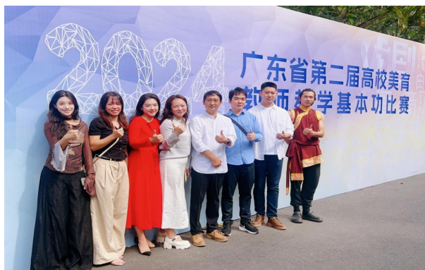
图8 广东省第二届高校美育教师基本功大赛参赛教师合照