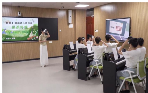
图 4VR 虚拟仿真融入课程