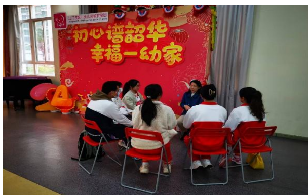
图 1 实践导师与学生开展教学研讨

学校联合政府、幼儿园、行业企业，搭建“校·园深度融合”平台。学前教育专业创办卓越幼儿教师培养实验班（下称“实验班”）。实施“学业导师+实践导师”双轨制，理论导师夯实专业素养，实践导师通过带班观摩、微课题研究锤炼保教技能，实现教学过程与岗位工作无缝对接。学前教育专业创新“平台+模块”课程结构，将三年划分为校内课程学习（2年）、企业共建课程（0.5年）、岗位实习（0.5年）三阶段。配套校内外双导师制——校内导师负责理论指导，校外一线导师负责职业实践，实现知识学习、技能实训与岗位应用的渐进融合。