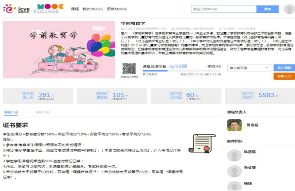
图3 《学前教育学》省级在线课程