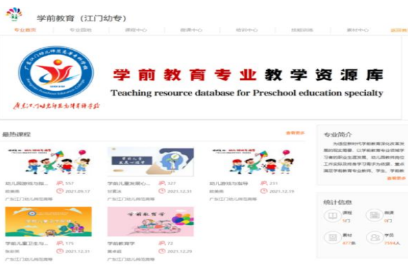
图6 智慧职教平台教学资源库