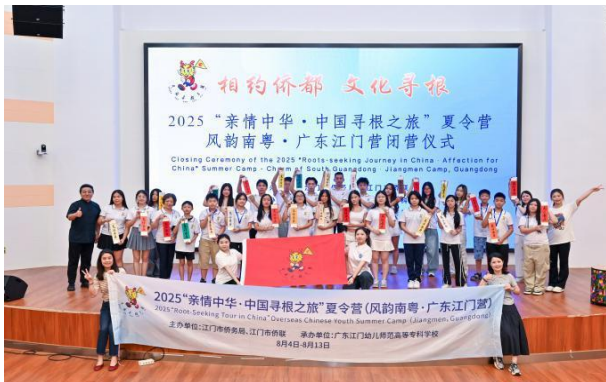
图3 “亲情中华·中国寻根之旅”夏令营