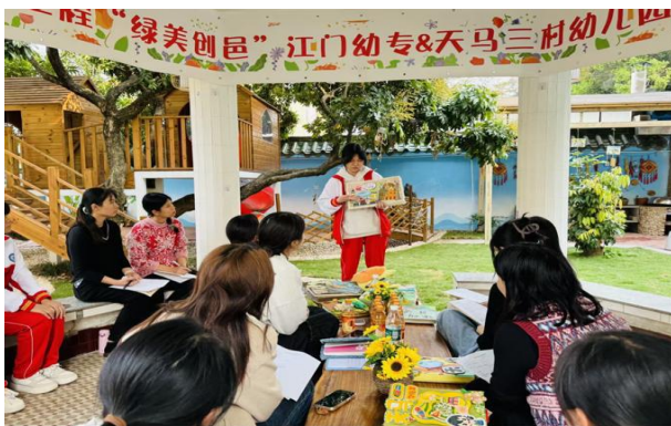
图5 学生与乡村幼儿园师生分享原创绘本

专业群开发了“奥尔夫音乐+粤剧+红色文化”融合课程，组建实践团深入乡村开展“订单式”美育服务。师生为乡村幼儿园创作本土绘本、绘制主题墙绘，通过“课程研发—教学实施—成果展演”闭环，提升学生综合实践能力。