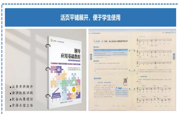
图 1 “十四五” 职业教育国家规划教材

本案例形成的教材建设与虚拟实训融合经验为省内高职学前教育专业提供范本，混合式教学与课程思政体系在区域院校广泛应用，课证融通教法被多所院校纳入人才培养方案。教学成果培育模式为同类专业提供成熟路径，相关经验已辐射粤东粤西粤北乡村师资培训，服务乡村振兴。下一步将深化产教融合共同体建设，把教材与教法改革成果输出至粤港澳大湾区更多院校与幼儿园，推动优质教学资源跨区域共享，持续赋能学前教育高质量发展。