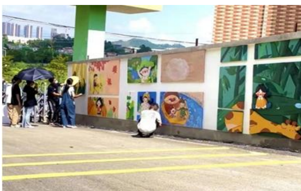
图1 环境美育润相处

本案例形成的“校-园-乡”协同美育模式、分层分类师资培训体系、四维绘本阅读推广机制具有高度可复制性。美育融合课程与“订单式”服务模式已在江门多个镇街复制应用，可为其他职业院校服务乡村振兴提供参照。省级师资培训的“四维”培养方法及全类别培训链条，已纳入省教育厅教师培训优秀案例库，可供全省同类院校借鉴。绘本阅读服务体系中的“常态化品牌+跨境传播”做法，已推广至澳门及粤西地区，并形成可输出的活动方案与原创绘本资源库。下一步可依托产教融合共同体，将上述经验输出至粤港澳大湾区更多职业院校及幼儿园，助力区域教育协同发展与乡村文化振兴。