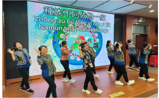
图2 印尼参训教师现场互动