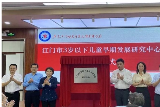
图1 江门3岁以下儿童研究中心揭牌仪式

分类培训体系助力教育均衡，产教融合共同体模式为民生领域提供发展范例，持续推动技术技能平台建设与区域民生发展同频共振。