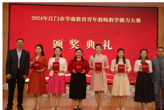
图2 承办2024年江门市学前教育青年教师教学能力大赛