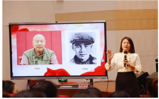
图4 “音乐党课”授课现场