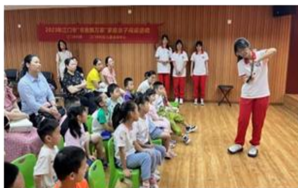
图2 绘本服务队开展活动