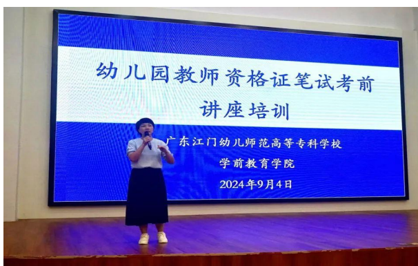
图 3 开展教师资格证培训