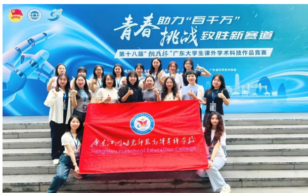
图7 “挑战杯”广东大学生课外学术科技作品竞赛参赛队伍合照