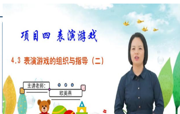
图2《幼儿游戏与指导》省级在线课程