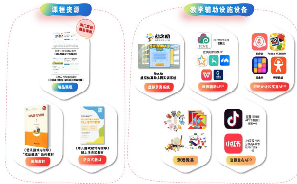
图4 《幼儿游戏设计与指导》线上资源