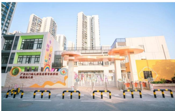
图 1 江门幼专附属幼儿园

本案例构建的“校内实训+校外实习+特色文化传承”三位一体实践教学基地模式，可在职业院校学前教育、艺术教育、体育教育类专业群复制推广。实训资源共建共享、管理制度标准化、信息化实习管理等做法，为同类院校优化实训条件、规范实践教学提供参考。省级培训平台与产教融合共同体建设经验，可推广至区域职业教育产教融合、校企协同育人领域。附属幼儿园办学模式与音乐文化中心传承路径，为职业院校服务基础教育、融入区域文化传承提供示范。