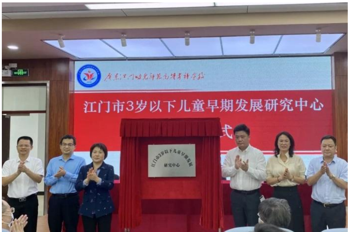
图2 江门市3岁以下儿童早期发展研究中心揭牌仪式