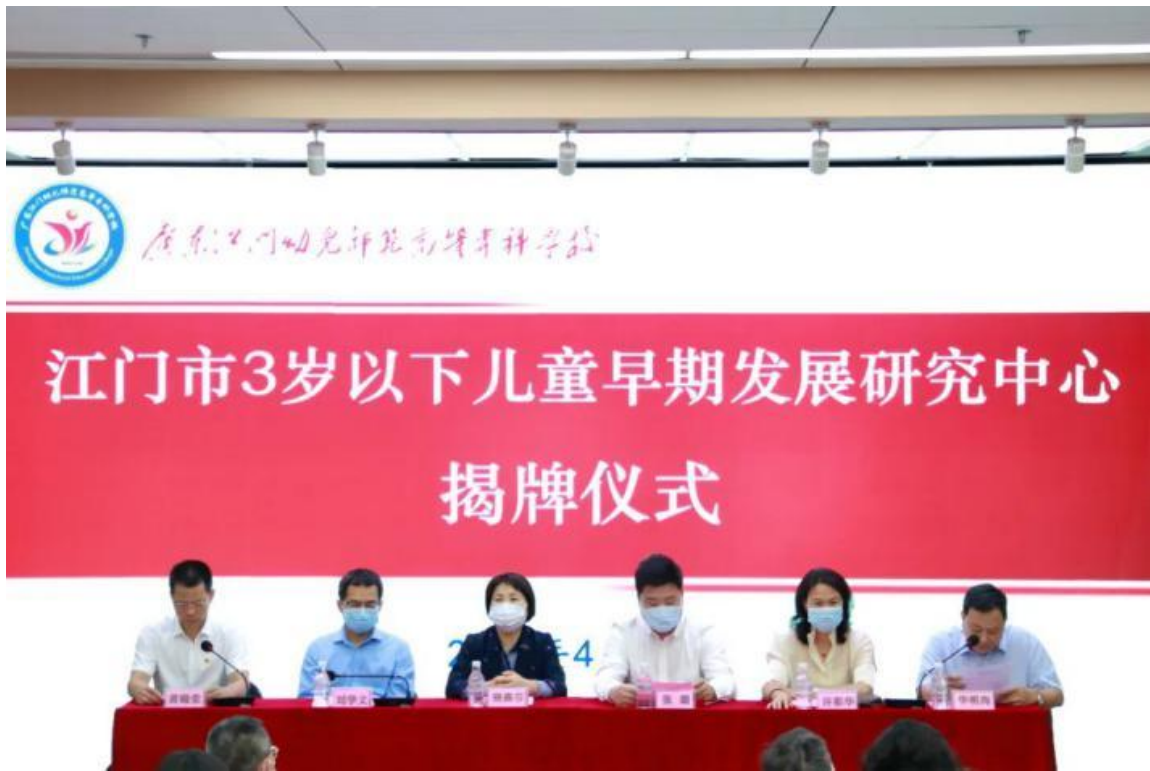
图1 江门市3岁以下儿童早期发展研究中心揭牌仪式